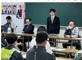
◎ 日産工機職場集会