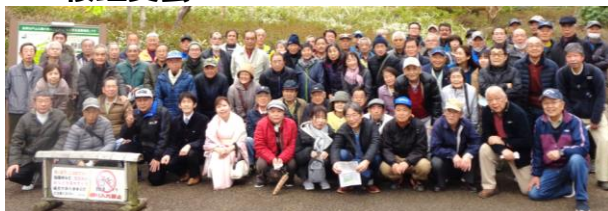
◎ エルダークラブ相模ブロック座間地区 ～桜鑑賞会～